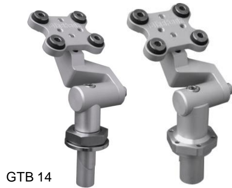
GTB 14 21 M* Honda Blackbird

NL : Kies de gewenste positie. GB : Select the desired position. D : Wählen Sie die gewünschte Position.